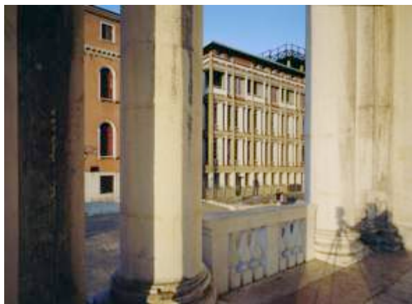
Palazzo per uffici e abitazioni INAIL a S. Simeone , Venezia, 2017

Il progetto di questa mostra nasce da una proposta dell'Archivio Progetti Iuav e dell'Università Roma Tre a complemento dell'indagine condotta sull'opera progettuale di Giuseppe Samonà esposta nelle gallerie del Rettorato. La vita delle opere di Samonà è colta attraverso lo sguardo di numerosi fotografi che hanno segnato in maniera determinante la veicolazione dell'opera di questo grande maestro. Attraverso il loro obiettivo leggiamo il programma di visualizzazione e comunicazione dell'architettura in quanto manifesto della componente linguistica monumentale che ha caratterizzato il lavoro di Samonà. Le fotografie selezionate non rappresentano solo una storia delle trasformazioni vissute dalle opere nel tempo ma generano una felice coesistenza del progetto con lo spazio circostante o negli ambienti stratificati storicamente.