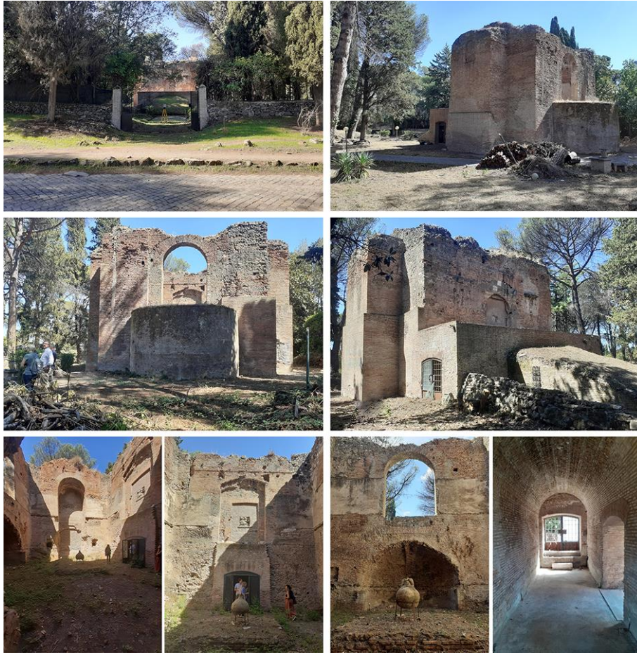
Mausoleo di Sant'Urbano al IV miglio della via Appia Antica.