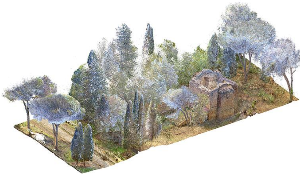
Nuvola di punti dell'area di pertinenza del mausoleo.