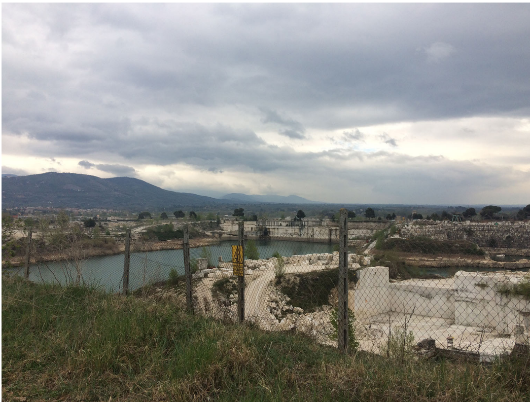
Le cave di travertino viste dal tracciato dell'Acqua Marcia, Tivoli, 2019.

Questa scomposizione avverrà attraverso le individuazioni di sistemi (naturali e antropici) che verranno studiati attraverso elaborati cartografici. Il tutto al fine di definire l'origine, la storia, le componenti materiali e immateriali che hanno strutturato il vasto territorio a est di Roma.